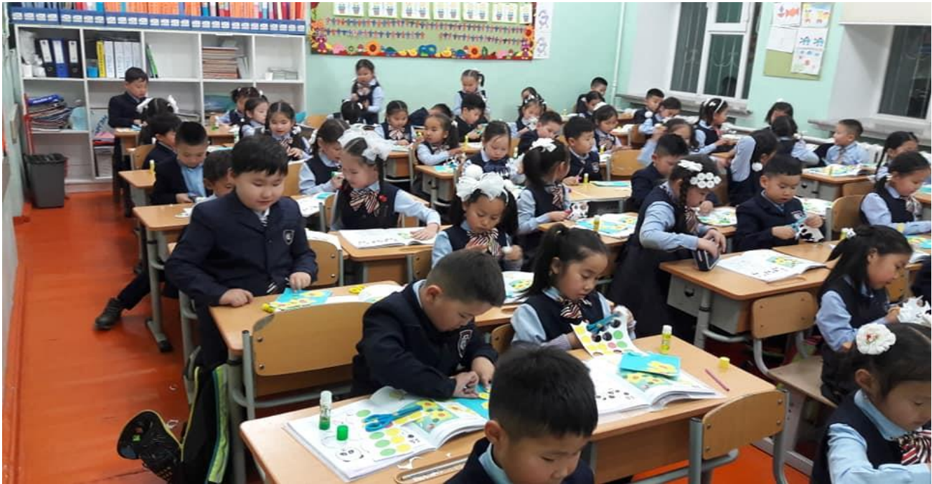
Бүтээл урлах явцаас