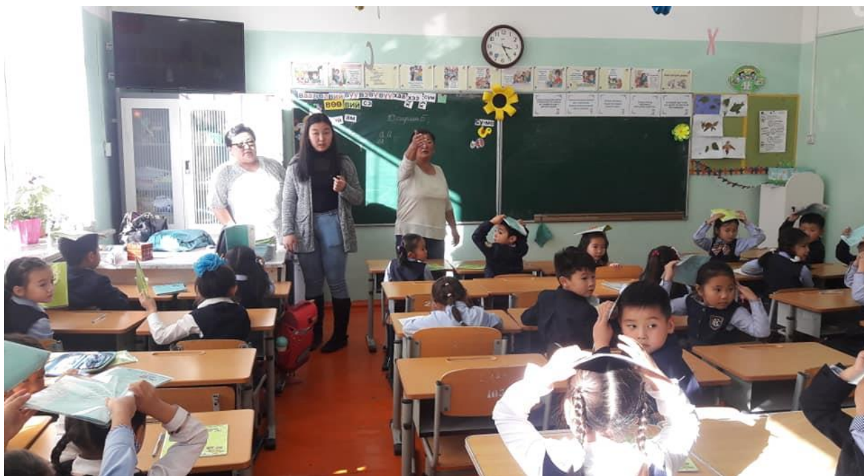
Эцэг эхийн нэг өдөр