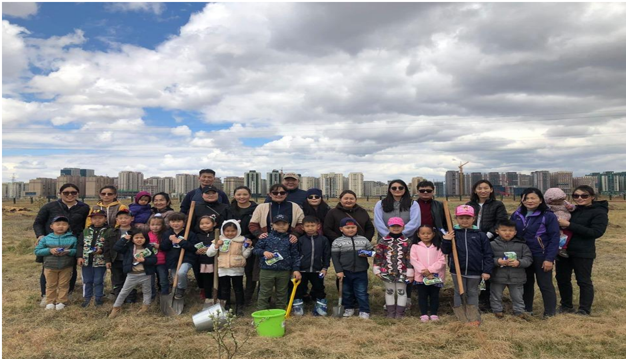
Бид ангиараа мод тарьлаа.