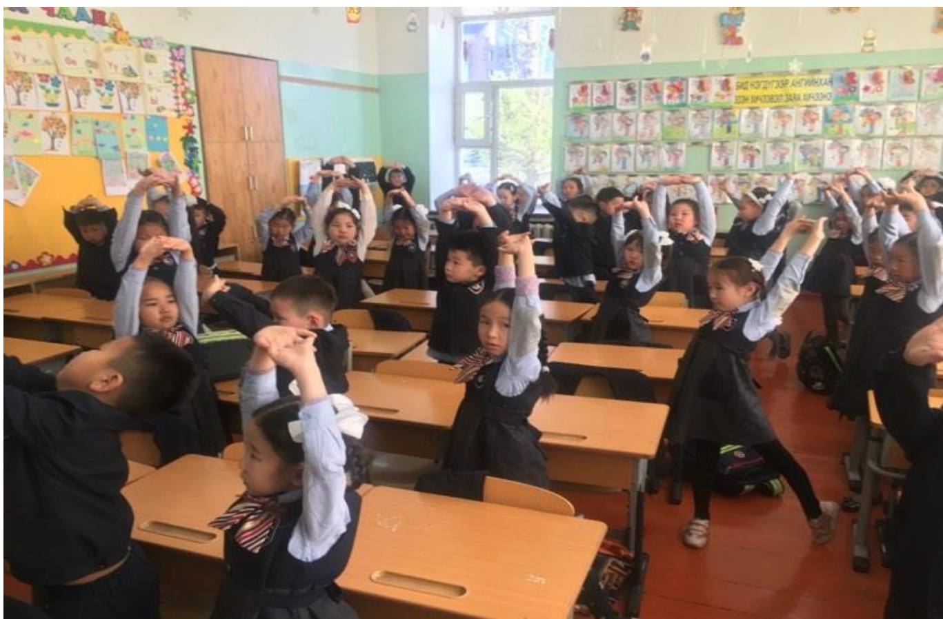
Хөдөлгөөн бидний эрүүл мэнд