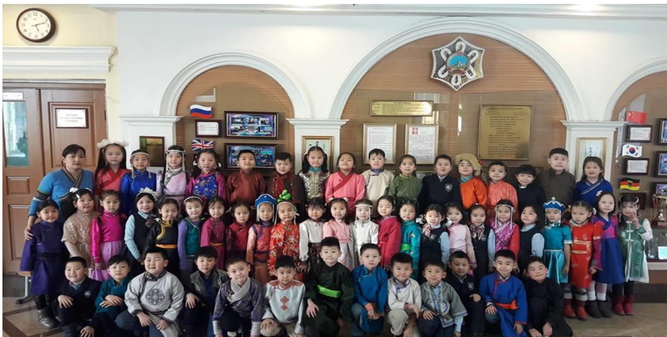
Дээлтэй Монгол өдөр