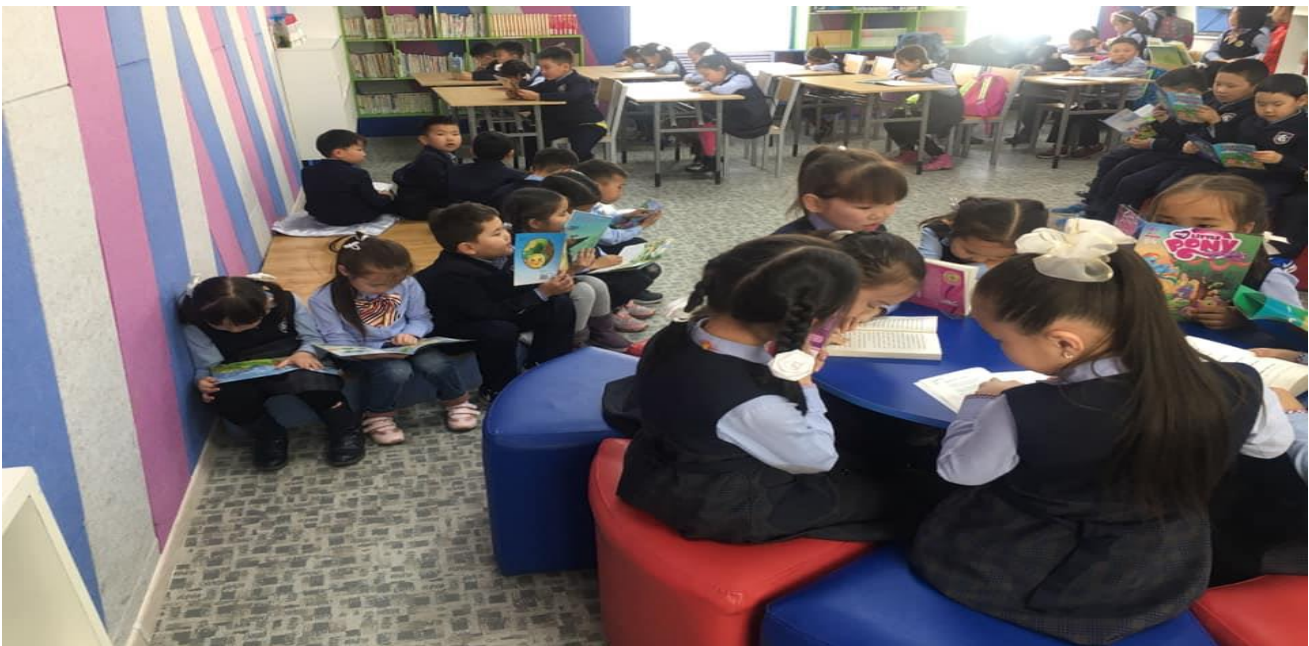
Унших, ойлгох чадварыг ахиулах зорилготой сургуулийнхаа номын сангаар аяллаа.