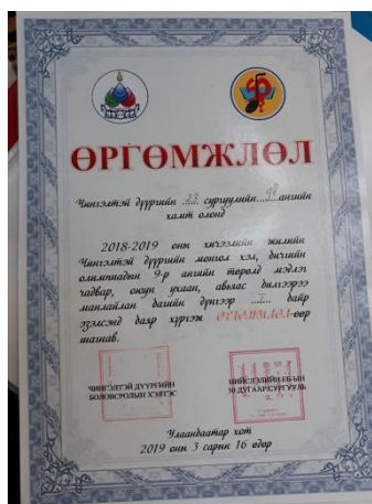
14. Хятад хэлний сургалттай “9 д анги”Чингэлтэй дүүргийн монгол хэлний анги нийтийн олимпиадад”Тэргүүн байр”