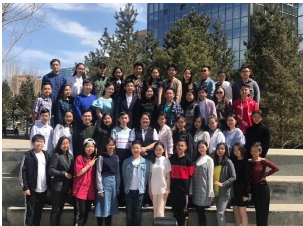
13. Олимпиад уралдаан тэмцээн :