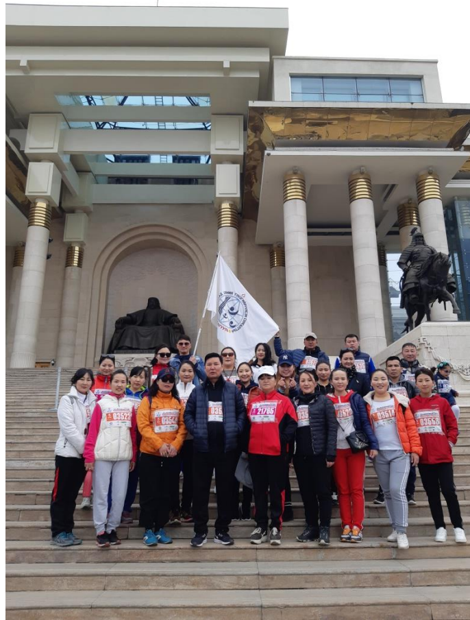
УЛААНБААТАР МАРАФОНД АМЖИЛТТАЙ ОРОЛЦОВ