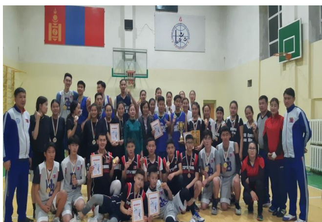
2018-2019 ХИЧЭЭЛИЙН ЖИЛИЙН САШ САГСАН БӨМБӨГИЙН ТЭМЦЭЭН