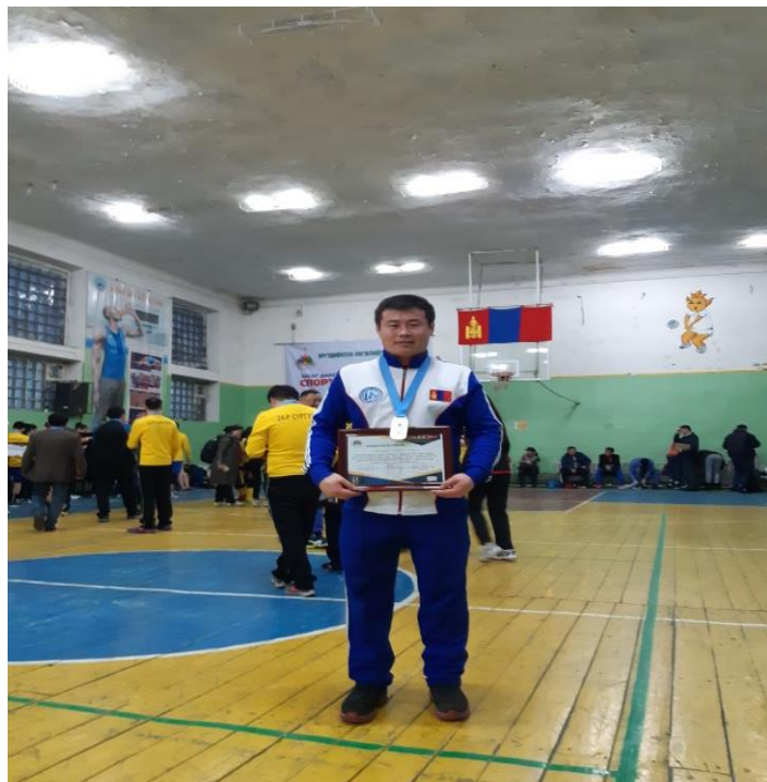
ДАШ “ТАМИРЧИН БАГШ-2019 “ ТЭМЦЭЭНИЙ ШИРЭЭНИЙ ТЕННИСНИЙ ТӨРӨЛД ДЭД БАЙР МӨНГӨН МЕДАЛЬ