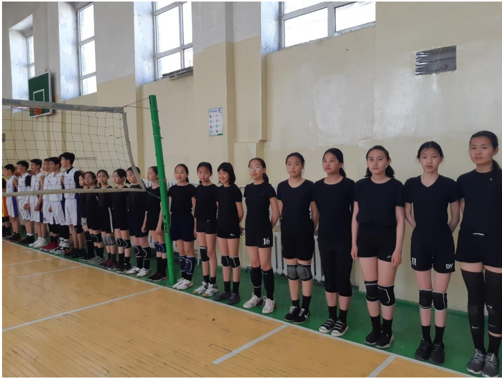
ВОЛЕЙБОЛЫН СЕКЦИЙН БАГА НАСНЫ ОХИДЫН БАГ