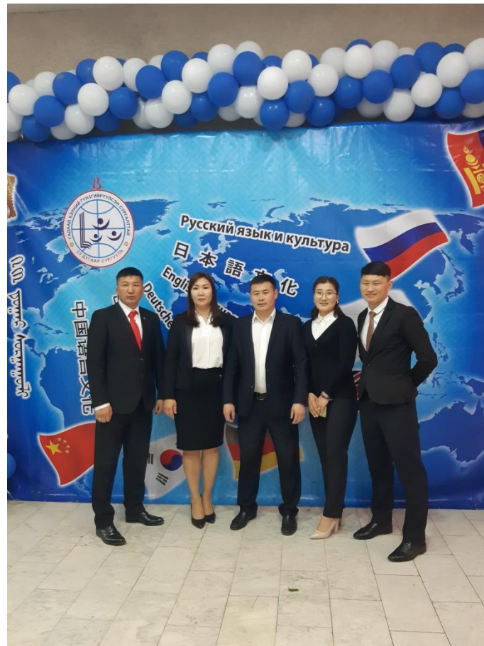
ГАДААД ХЭЛНИЙ НААДМЫН ЗОХИОН БАЙГУУЛЛАТЫН ҮЙЛ АЖИЛЛАГААНД ГАР БИЕ ОРОЛЦОВ