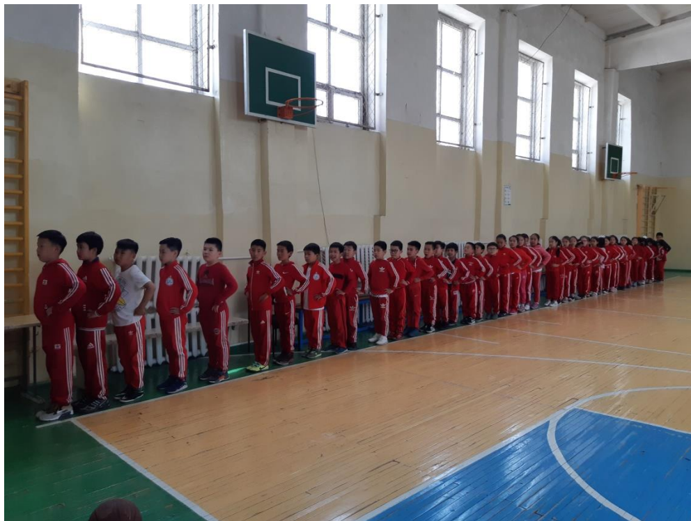
БАГА АНГИЙН СУРАГЧИД АНГИАС ЗААЛ РУУ ЗААЛНААС АНГИ РУУ НЭГИЙН ЦУВААНД ГАРАА ТАШААНДАА АВАН ЯВЖ ХЭВШЛЭЭ