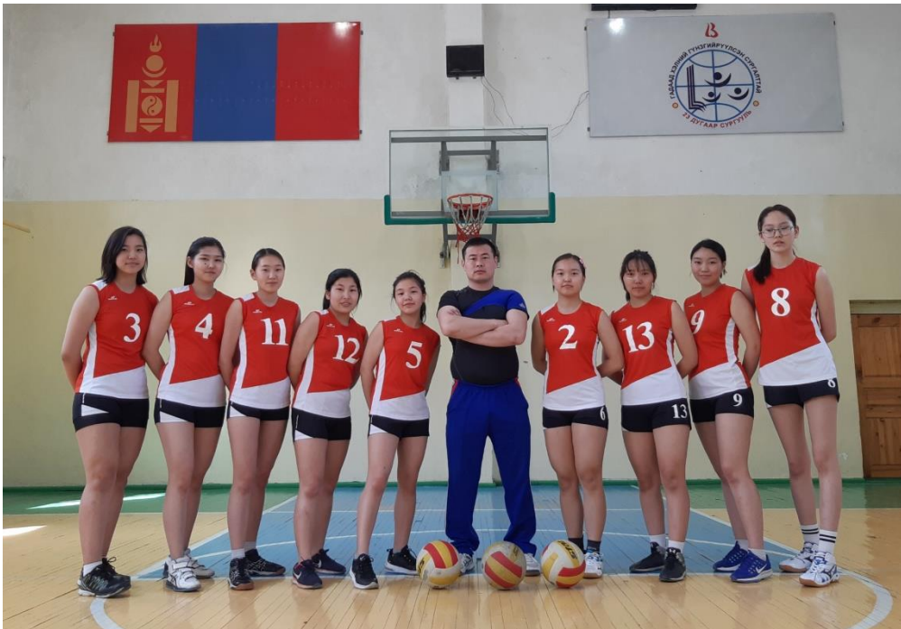
ДУНД АХЛАХ НАСНЫ ОХИДЫН ШИГШЭЭ БАГ