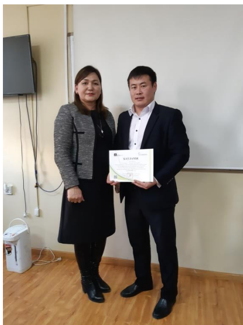
БМДИ-Н ҮНДСЭН СУРГАЛТАНД ХАМРАГДАВ