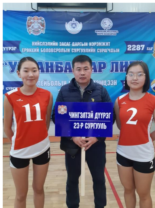
НАШ УЛААНБААТАР ЛИГ ТЭМЦЭЭН