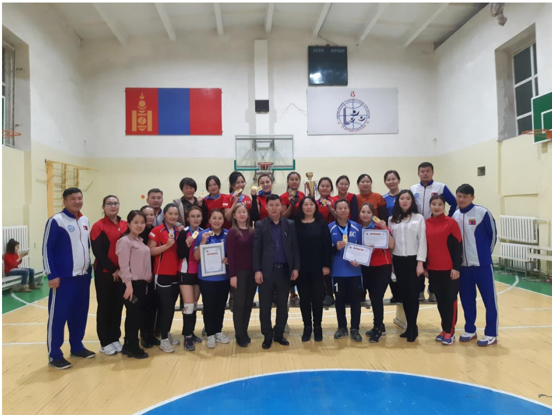
ЧД-ИЙН ГАДААД ХЭЛНИЙ СУДЛАГДАХУУНЫ БАГШ НАРЫН ТЭМЦЭЭНИЙГ АМЖИЛТТАЙ ЗОХИОН БАЙГУУЛАВ