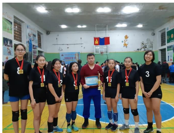
ДАШ "ВОЛЕЙБОЛ"-ЫН ТЭМЦЭЭН ТЭРГҮҮН БАЙР АЛТАН МЕДАЛЬ