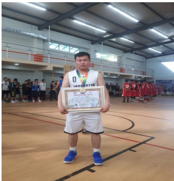
НАШ ТАМИРЧИН БАГШ-2018 “САГСАН БӨМБӨГ” ТЭМЦЭЭН ДЭД БАЙР МӨНГӨН МЕДАЛЬ