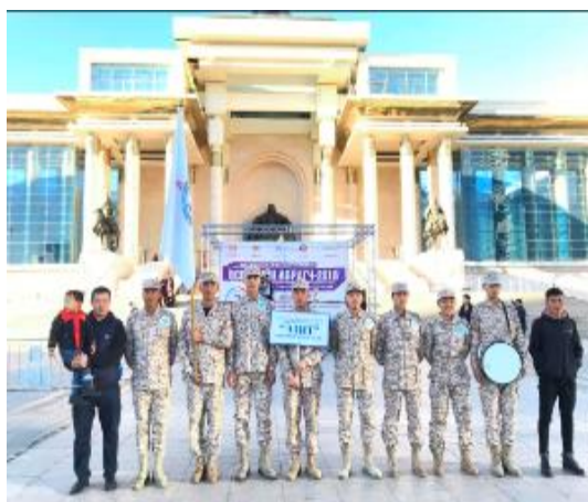
НАШ "ӨСВӨРИЙН АВРАГЧ" ТЭМЦЭЭН ДЭД АВАРГА