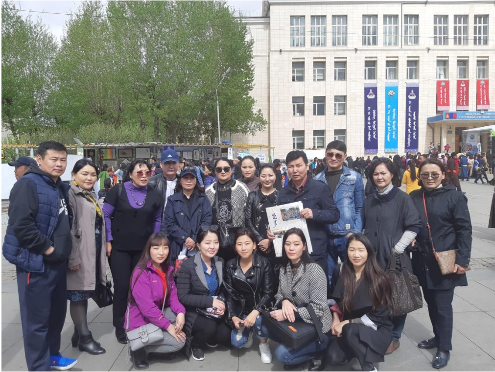
ЧИНГЭЛТЭЙ ДҮҮРГИЙН ИРГЭДИЙН НААДАМ 2019