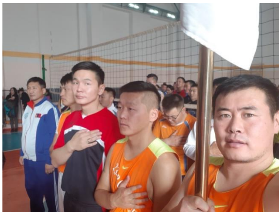
ЧД- ИЙН ҮЭХОРООН ТЭМЦЭЭНД ОРОВ