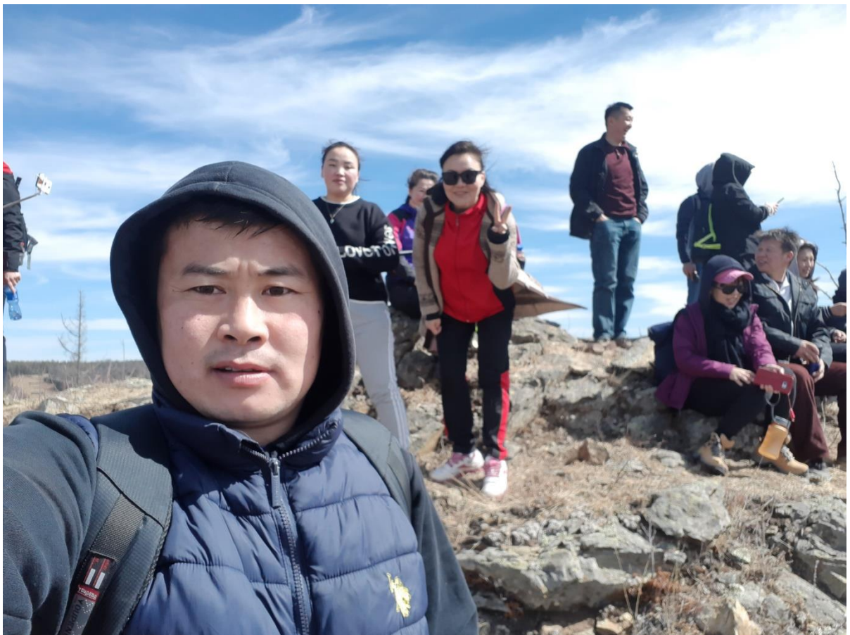
ЭРҮҮЛ АГААР ЭМ – ЯВГАН АЯЛАЛ