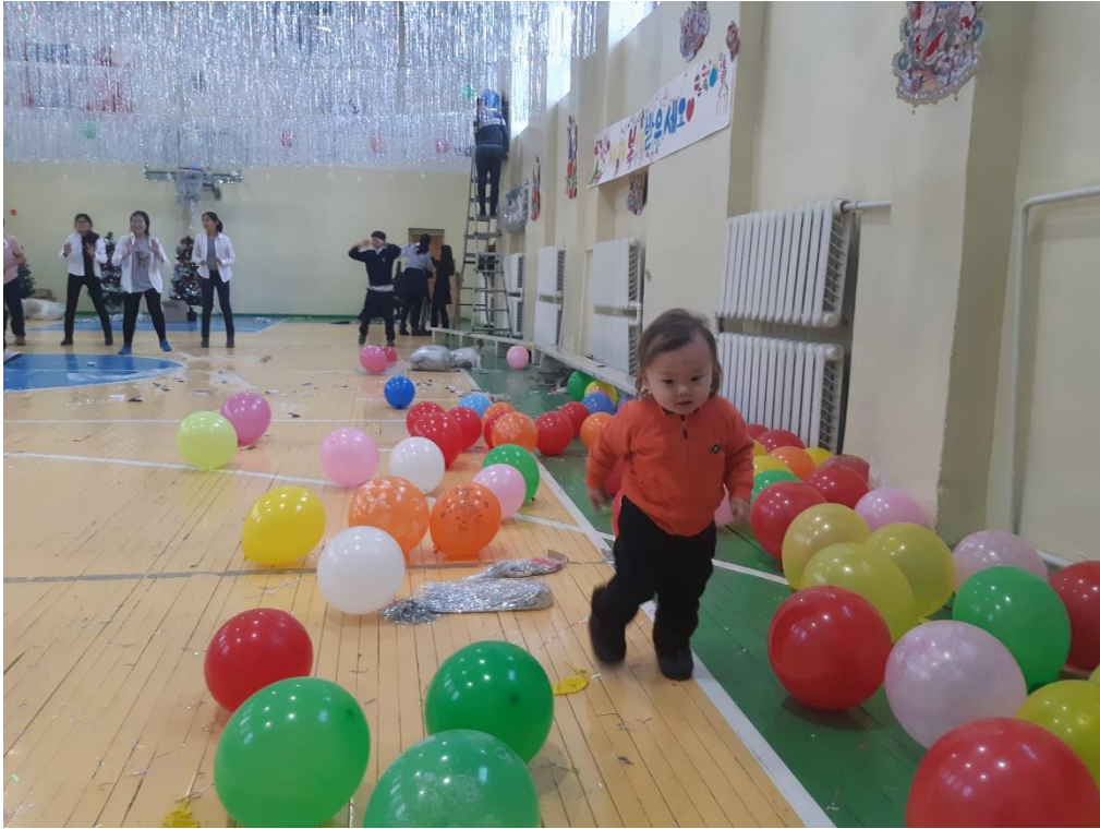
СУРГУУЛИЙН ШИНЭ ЖИЛ ЗОХИОН БАЙГУУЛАХ СПОРТ ЗААЛНЫ ЧИМЭГЛЭЛИЙГ ЭЦЭГ ЭХЧҮҮДТЭЙ ХАМТРАН ХИЙВ