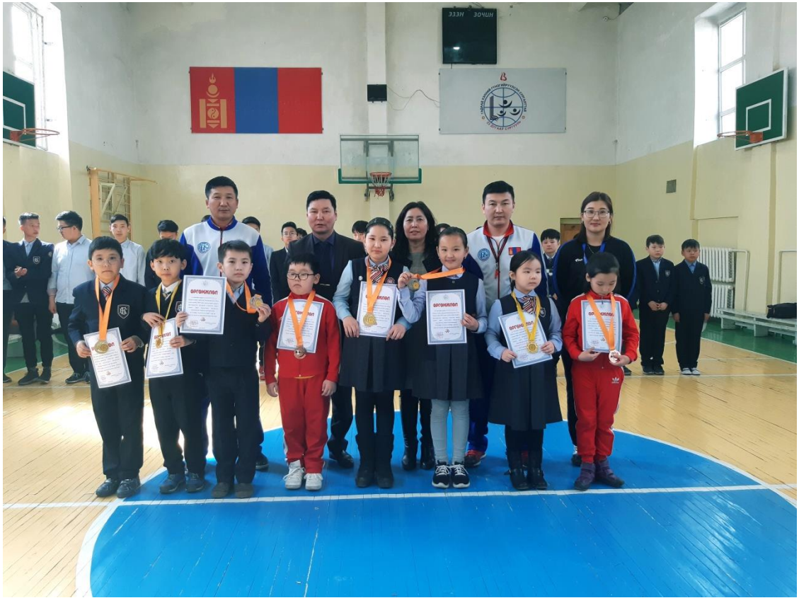
СУРГУУЛИЙН АВАРГА ШАЛГАРУУЛАХ ШАТРЫН ТЭМЦЭЭН