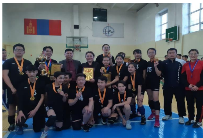
2018-2019 ХИЧЭЭЛИЙН ЖИЛИЙН САШ ВОЛЕЙБОЛЫН ТЭМЦЭЭН