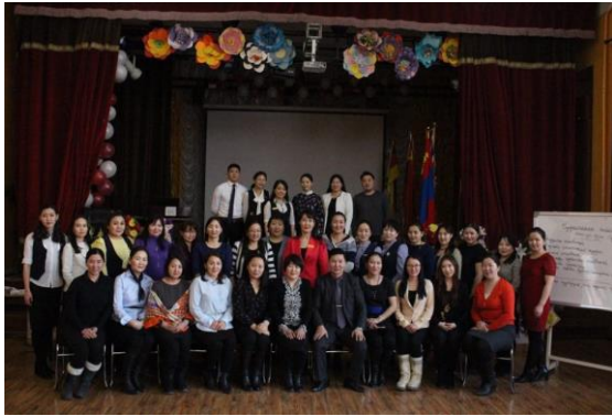
Нийслэлийн багш нарт Илтгэл хэлэлцүүлэв