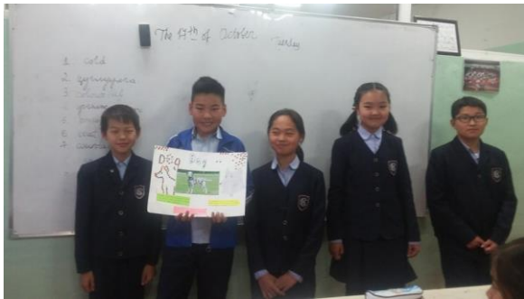
Ярианы хичээлийн үйл явц