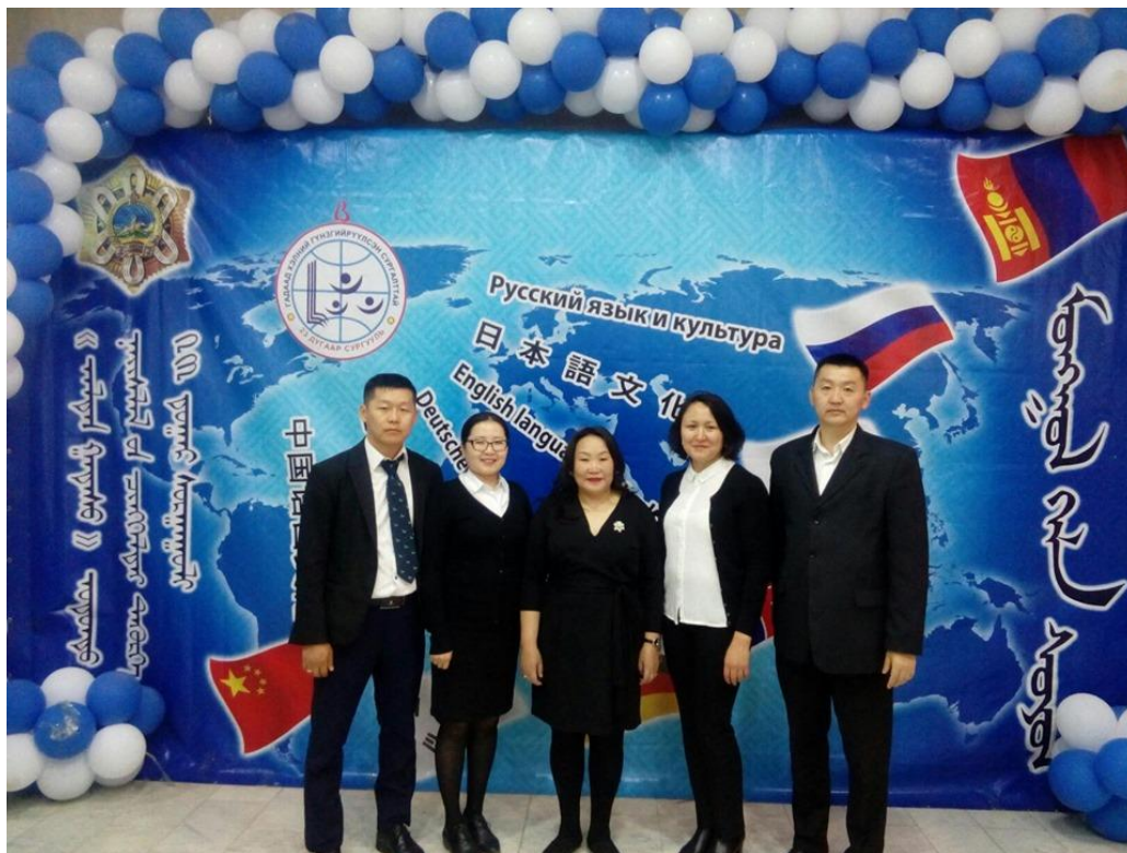
Зураг 1. Гадаад хэлний баярын үйл ажиллагаа