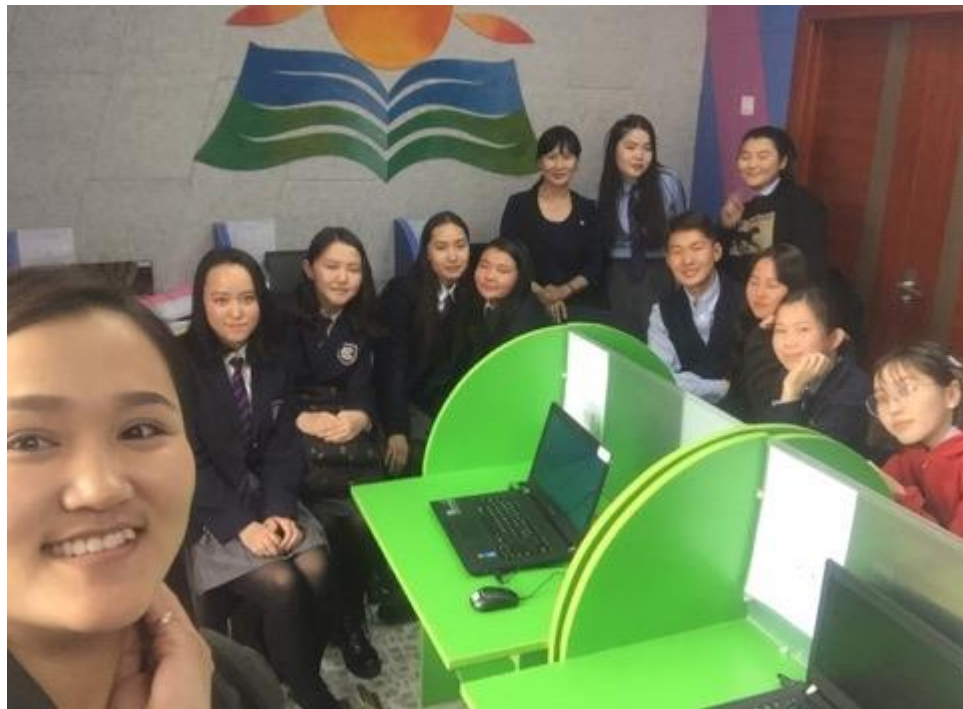
Зураг 8. Чинэлтэй дүүргийн хэлэлцүүлэгт бэлтгэн танилцуулга хийж буй байдал