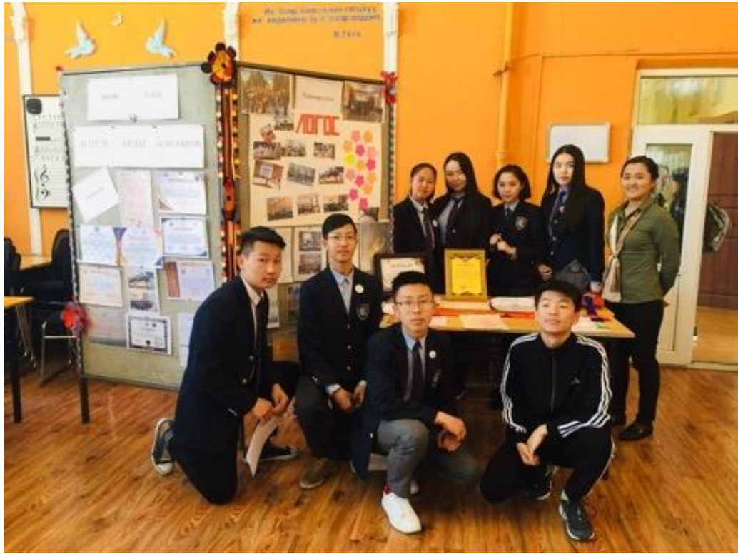
Зураг 3. Хичээлээс гадуурх илтгэх урлаг мэтгэлцээний Логос клуб тайлан хамгаалалт