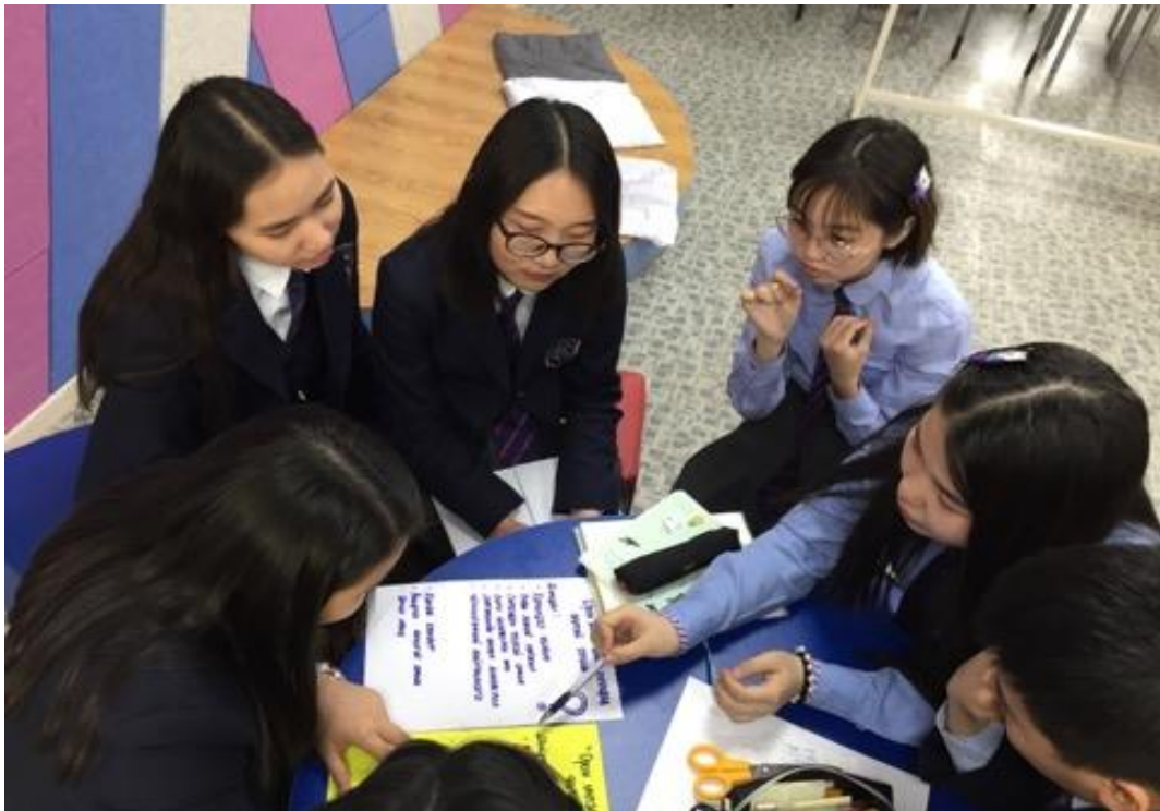
Зураг 4. Хүүхдийг зодож шийтгэхгүй байх өдрийн тохиолдуулан зохион байгуулж буй хэлэлцүүлэг