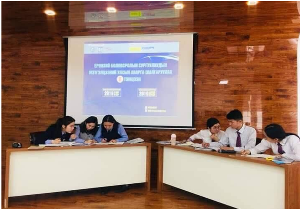
Зураг 6. Нийслэлийн аварга шалгаруулах мэтгэлцээний тэмцээний явц