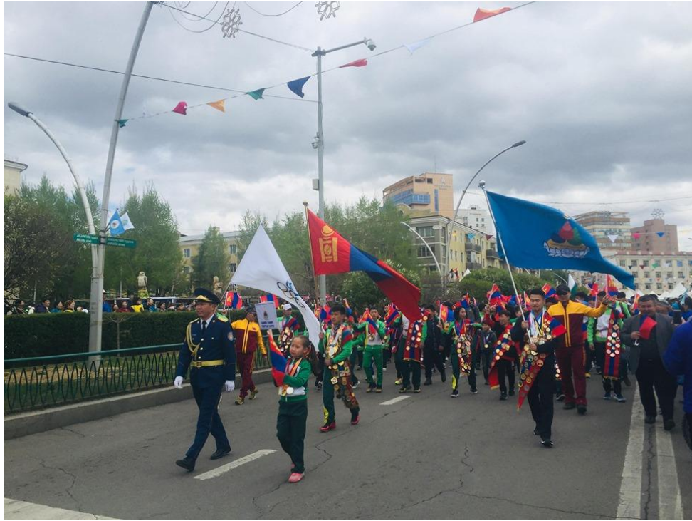
Зураг 11. Чингэлтэй дүүргийн иргэдийн баяр