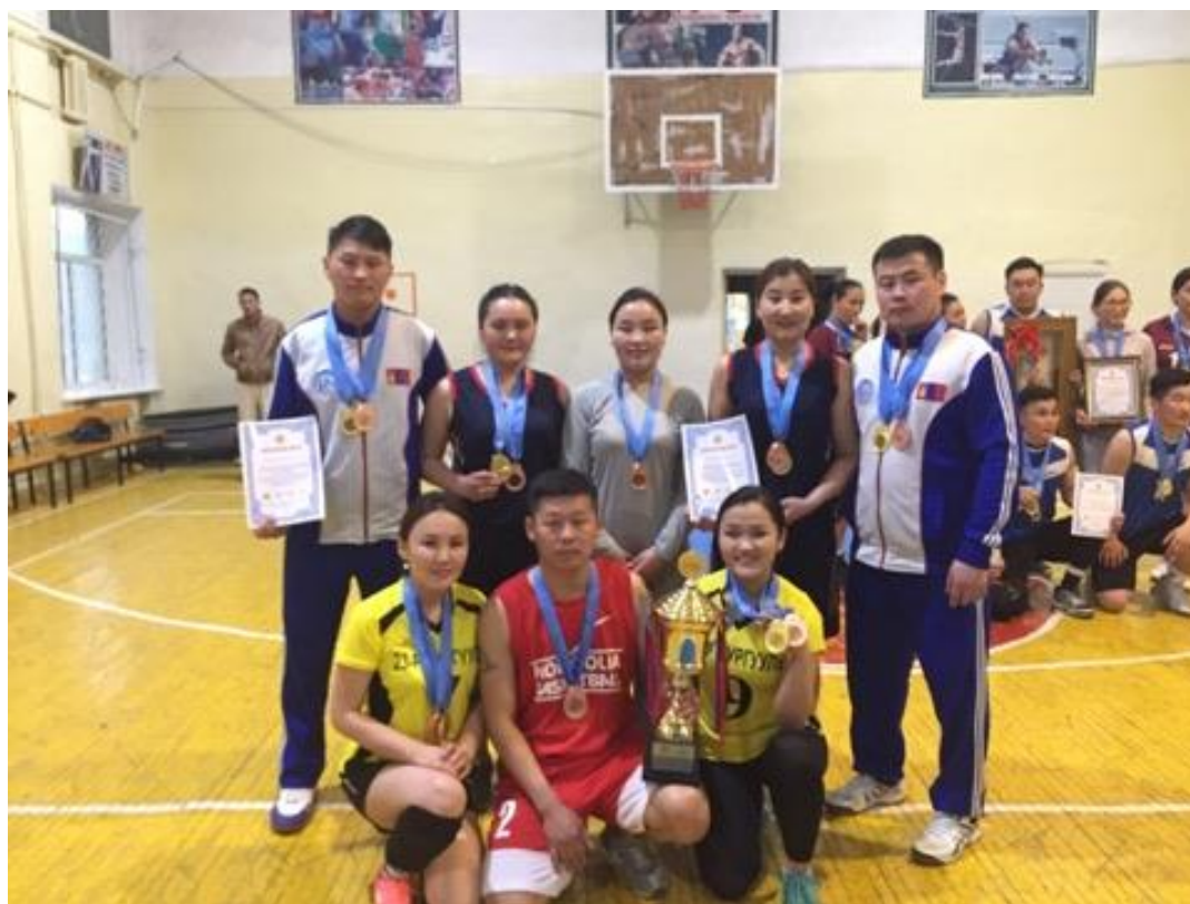
Зураг 2. Залуу багш нарын спорт өдөрлөг