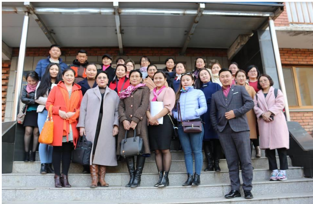
Зураг 6. Үе тэнгийн дарамт, дээрэлхэлтийн сургагч багш нар