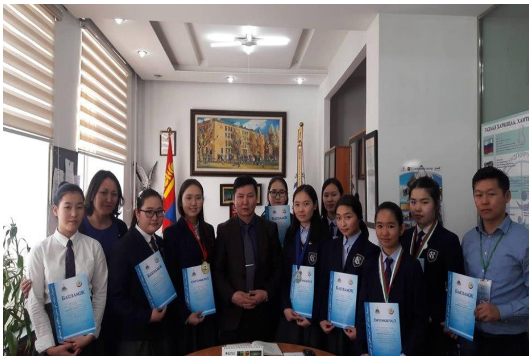
Зураг 9. дүүргийн түүх, нийгмийн ухааны олимпиадад амжилттай оролцсон сурагчид захирлын хамт