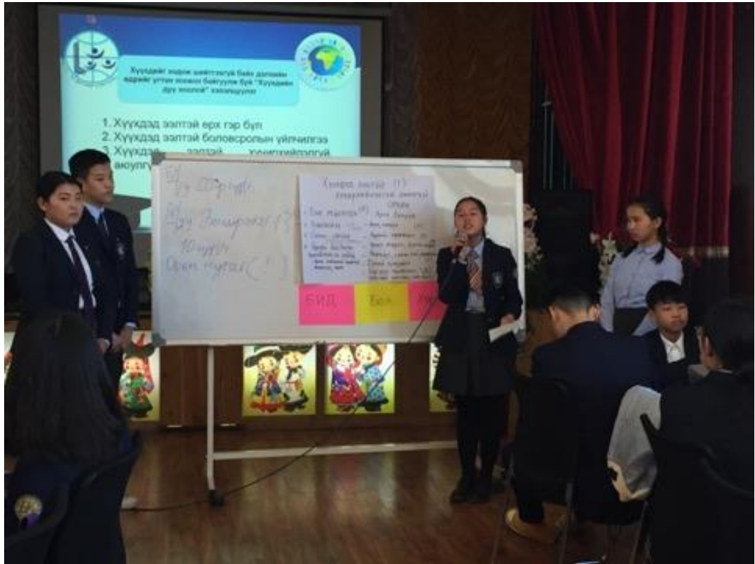
Зураг 5. Хүүхдийг зодож шийтгэхгүй байх өдрийг тохиолдуулан зохион байгуулсан хэлэлцүүлэг