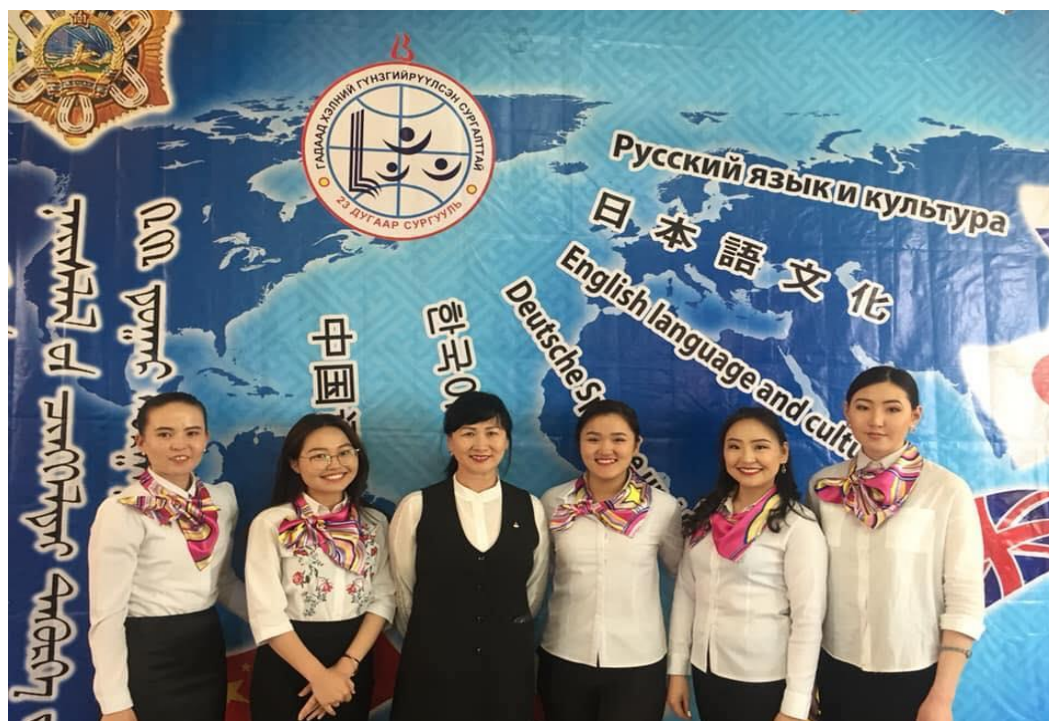
Зураг 10. Цахим сургалтын танилцуулга үлй ажиллагааны угталтын баг