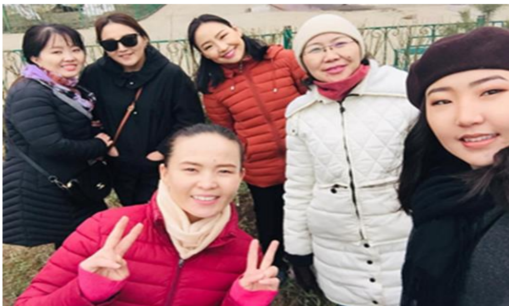
Бүх нийтийн мод тарих өдрөөр мод тарив