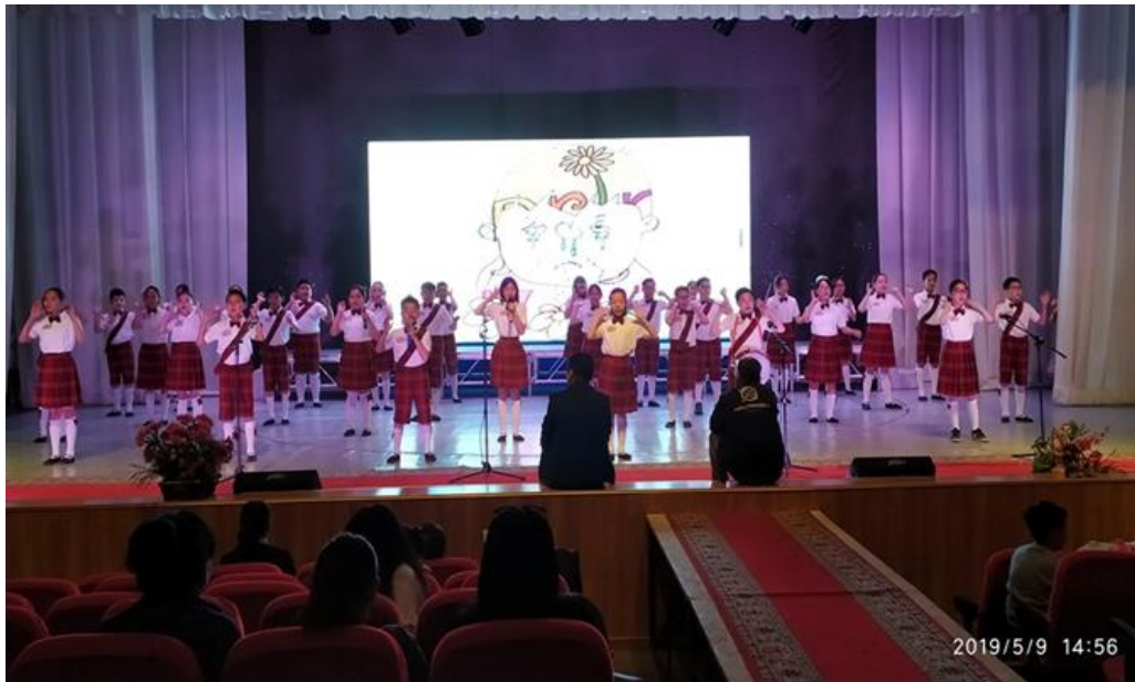
6в ангийн сурагчид Хэлний наадмаар МХО-д тоглож байна