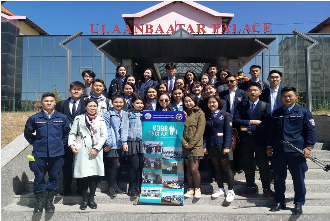
116, 11д ангийг хариуцан “Зөв Тусгал” үйл ажиллагаанд оролцов