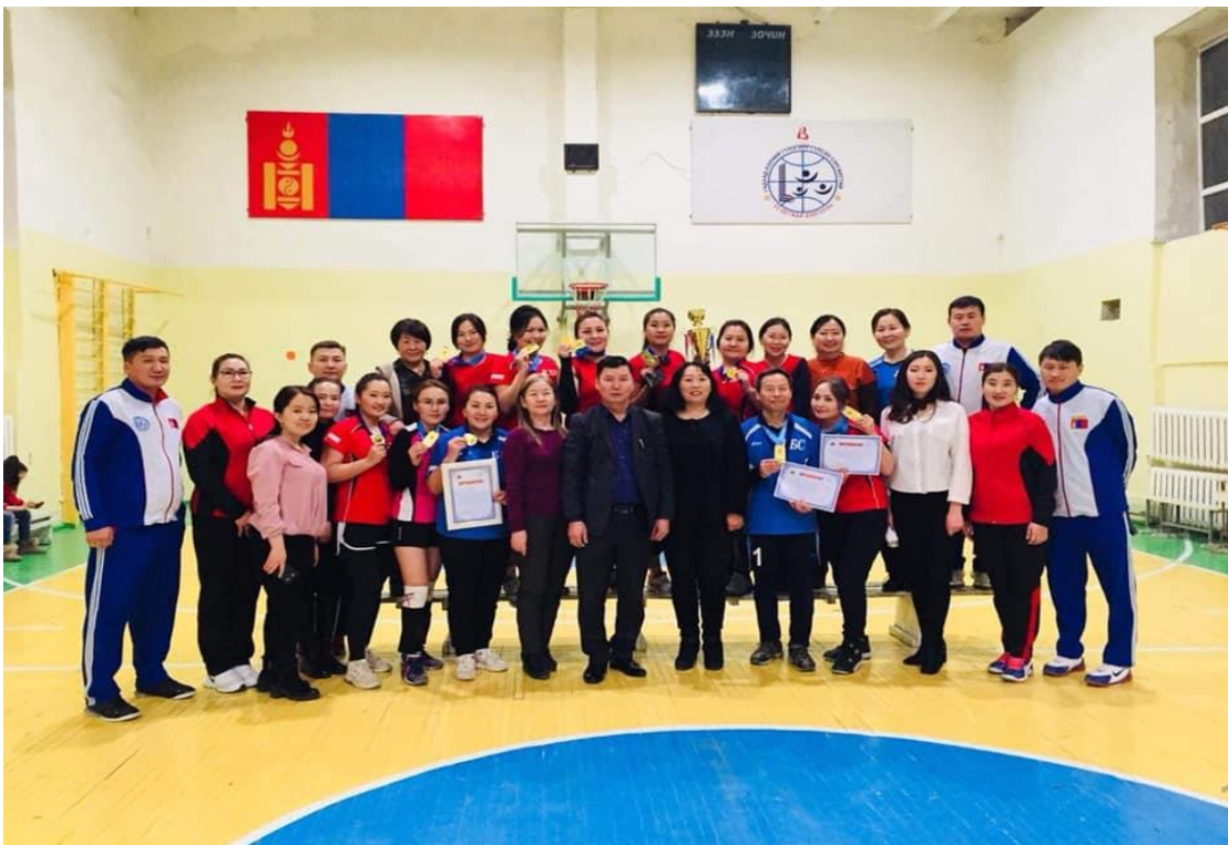
ЧД-ийн судлагдахууны багш нарын дунд зохион байгуулсан тэмцээний санхүүг хариуцан ажилласан.