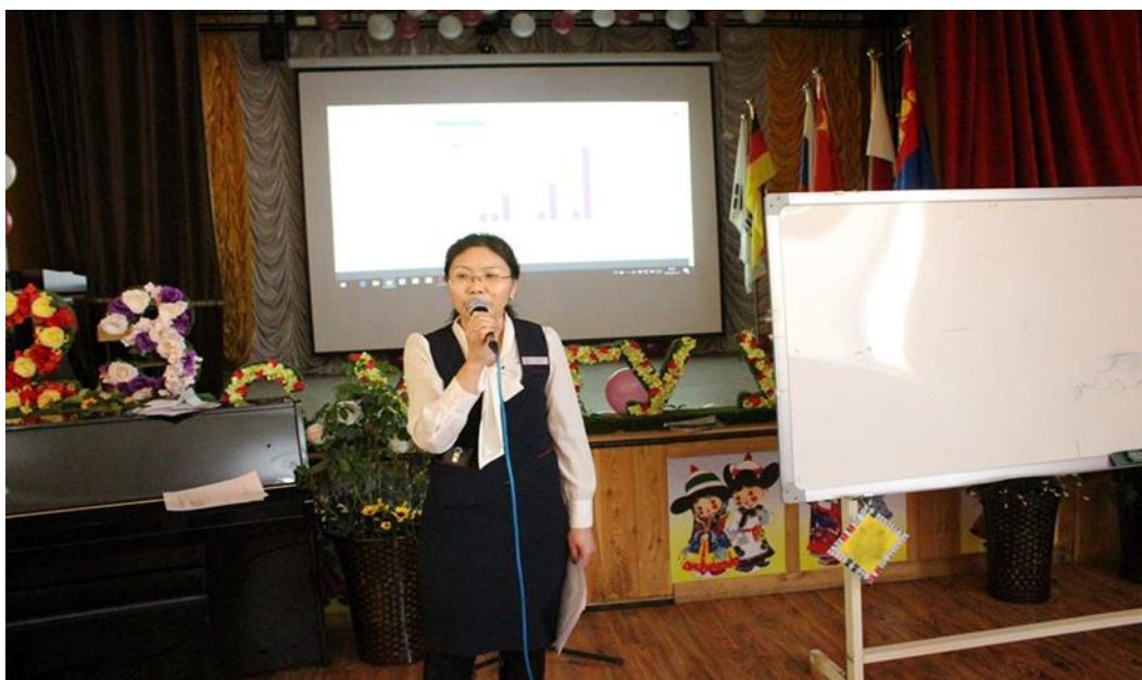
Хэлэлцүүлэгт хичээлийн чиглүүлэгч багшаар ажиллаа