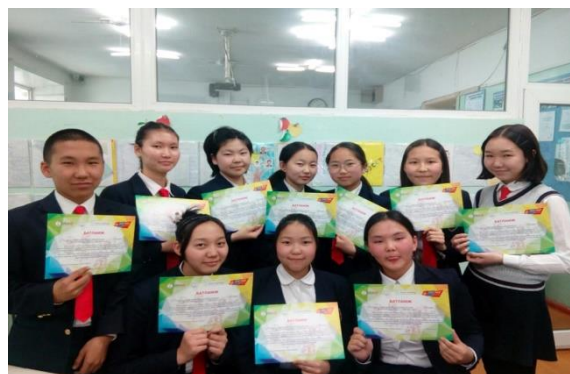
“Иргэн төсөл”-ийн үйл ажиллагааны явцаас