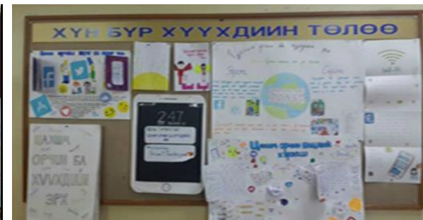
Цахим орчим ба хүүхдийн эрх сэдэвт бүтээлийн үзэсгэлэн