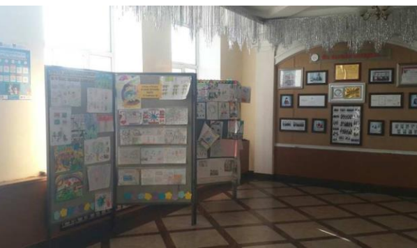
Олон улсын хүний эрхийн өдөрт зориулж “Эрхүү дархлаажуулъя – Та ч бас эрхээ” сэдэвт сурагчдын гар зургийн бүтээлийн үзэсгэлэн