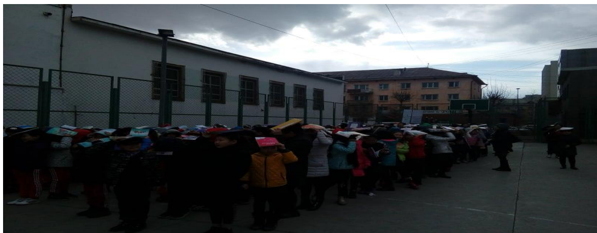
Гамшигаас хамгаалах сургуулилалт