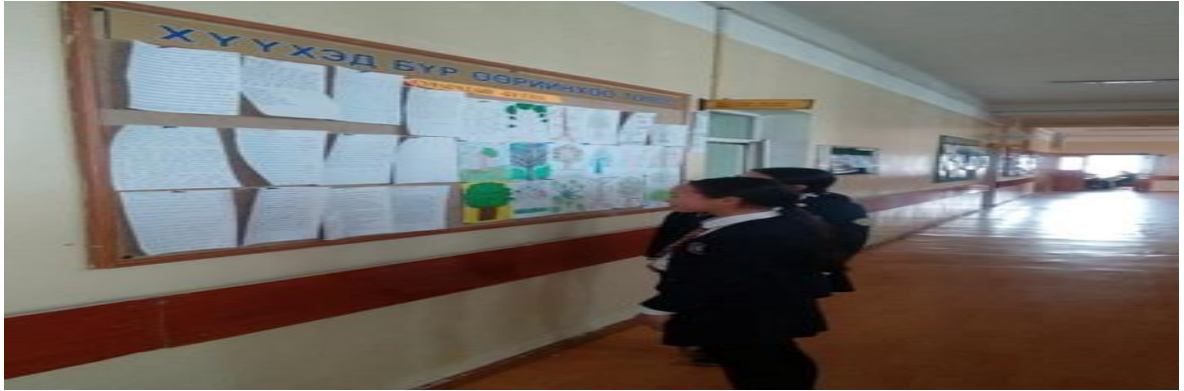
“Миний мэдэх Чингис хаан” эсээ бичлэгийн уралдаанд шалгарсан сурагчдын бүтээл