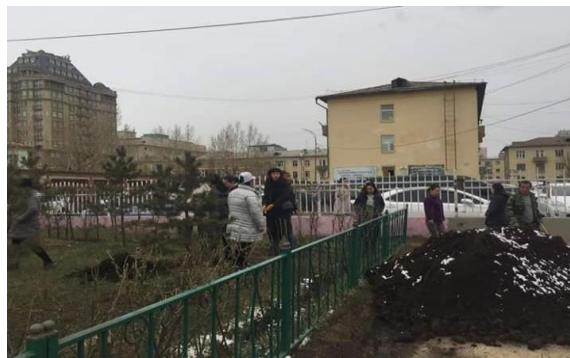
“Үндэсний мод тарих өдөр”-т оролцон сургуулийн ногоон талбайн цэвэрлэгээ үйлчилгээний ажилд оролцон ажиллав.