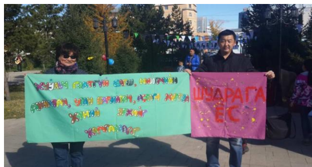
Иргэний нийгмийн 50 гаруй ТББ-аас хамтран зохион байгуулсан Democrazy carnival-2018 үйл ажиллагаанд IX ангийн сурагчдыг хамруулав.