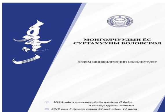
ШУА-ийн Философийнн хүрээлэн, Академич Р.Нарангэрэл хамтран зохион байгуулсан “Монголчуудын ёс суртахууны боловсрол” хэлэлцүүлэгт оролцов.