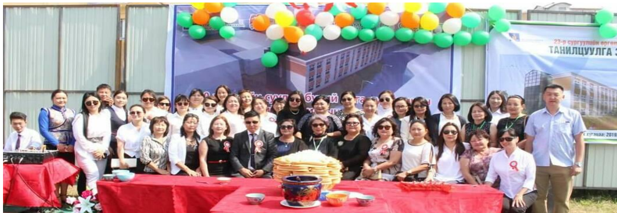
Сургуулийн өргөтгөлийн шав тавих ёслолын үйл ажиллагаа