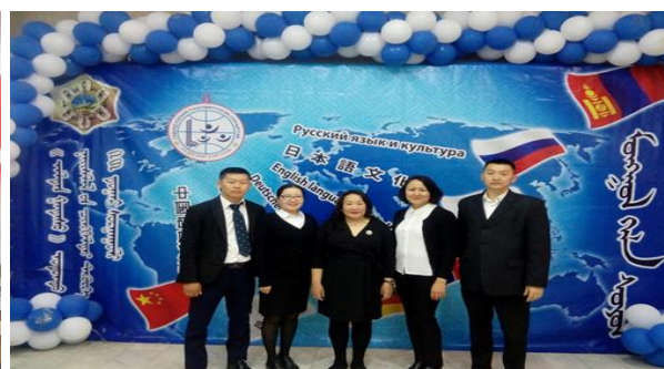
Хичээлийн шинэ жилийн нээлтийн үйл ажиллагаа, хэлний баярын үйл ажиллагаа